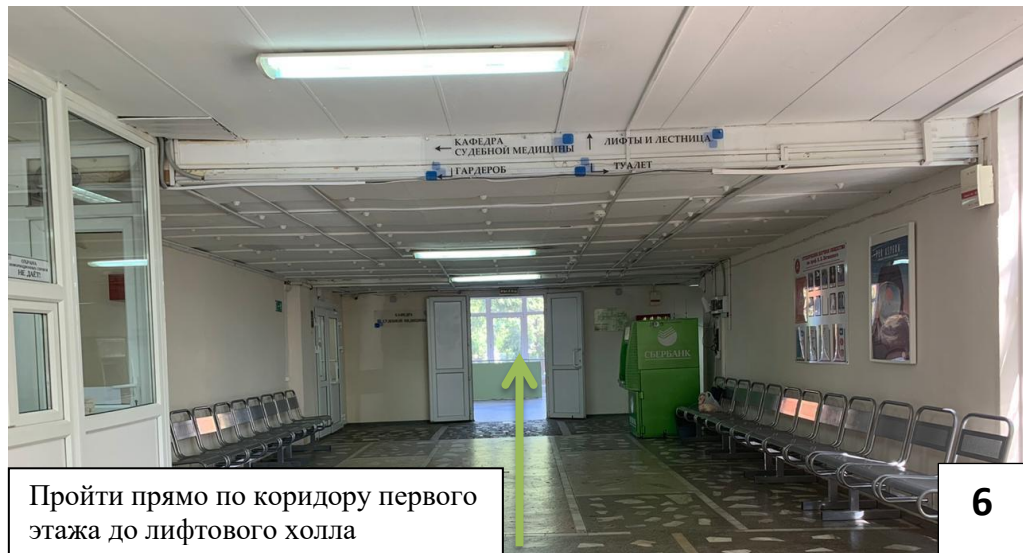
Пройти прямо по коридору первого этажа до лифтового холла