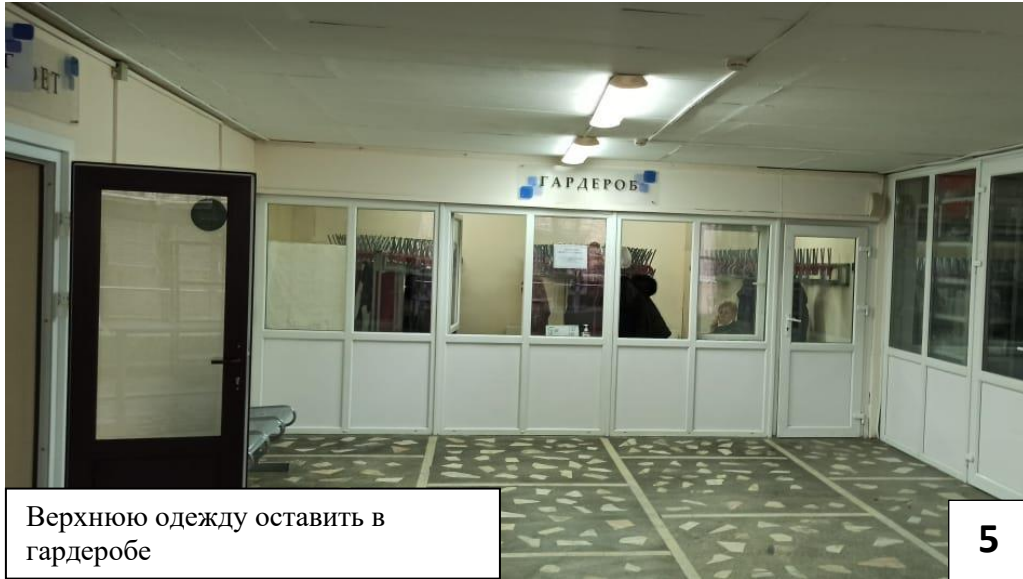
Верхнюю одежду оставить в гардеробе